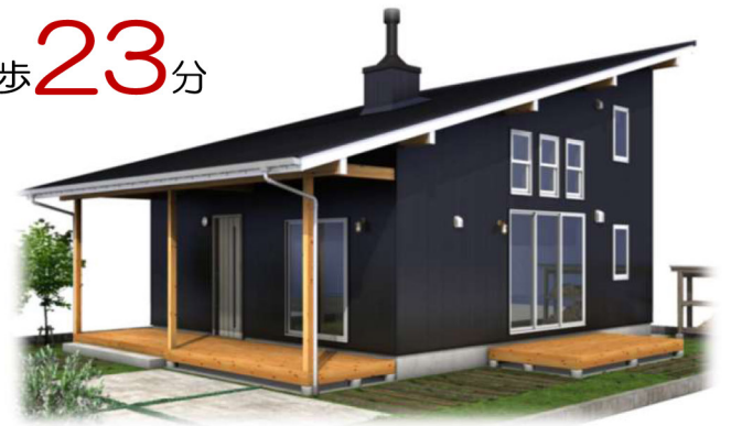
※モデルハウス完成イメージ