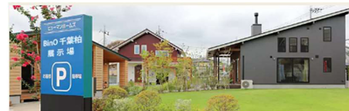
「BinO千葉柏展示場」住所: 柏市篠籠田980-1