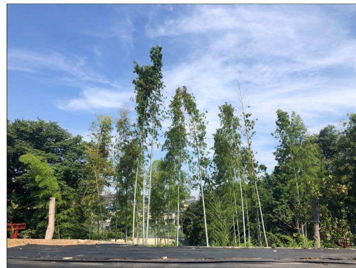
「北側からのロケーション」