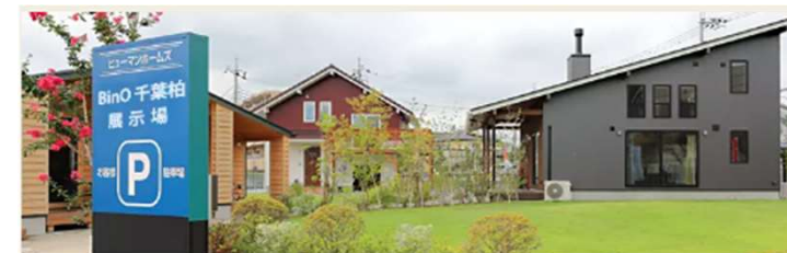
「BinO千葉柏展示場」住所: 柏市篠籠田980-1